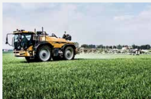
Einsatz beim Pflanzenschutz: Nachgemachte Sprühmittel führen zu Ernteverlusten.