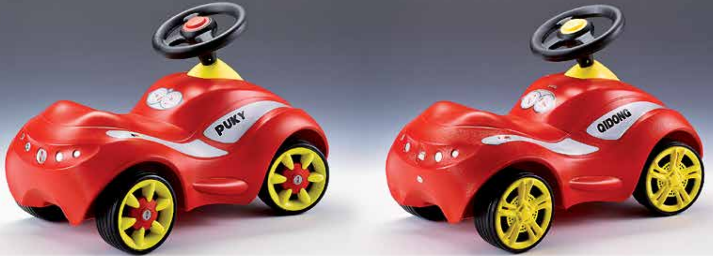
Echt jetzt oder Fake? Original Rutsch-Roller und Kopie (rechts).

Wir haben Fälle von Plagiaten erlebt, die gerade einmal 10 Prozent unserer Richtwerte erreichten – der Schaden an der Bausubstanz war beträchtlich. Im Kampf gegen diese kriminellen Machenschaften geht es uns deshalb um zwei Dinge: zum einen um ein Sensibilisieren von Verarbeitern und Endkunden und zum zweiten um das Bereitstellen von Hilfsmitteln wie einem speziellen Detektor, mit dem sich unsere Folien eindeutig identifizieren lassen.