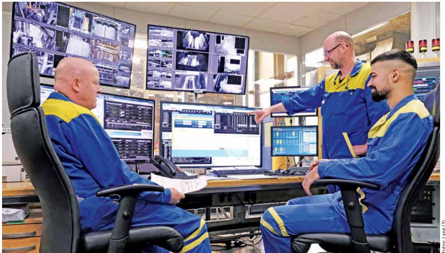
Auf einen Blick: Die fortschreitende Automatisierung erhöht die Produktivität und Flexibilität.