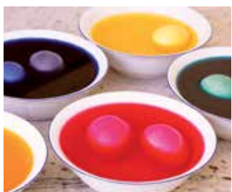
Farbenfroh: Beim Eierfärben ist Kreativität gefragt.