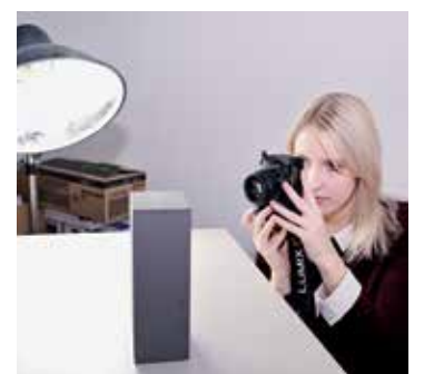
Foto und Video

Man muss in meinem Beruf gerne kommunizieren und kontaktfreudig sein, aber auch Geduld haben. Stolz bin ich auf unsere 20.000 Follower auf Facebook unter oasisfloralproducts.deutschland und 3.000 Follower auf Instagram. Oft bekomme ich nette, manchmal aber auch ärgerliche Kommentare von Usern. Da muss man tief durchatmen und immer freundlich bleiben!