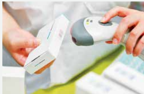
Letzter Check vor der Abgabe: Per Scan kann die Apotheke feststellen, ob ein Medikament echt ist oder nicht.

Rund 100 Mitarbeiter waren bei AbbVie in die Einführung involviert. Und beim Pharmakonzern Boehringer Ingelheim mussten 28 Standorte in Europa ihre Arzneiproduktion aufwendig umrüsten; knapp 2.000 Artikel waren betroffen.